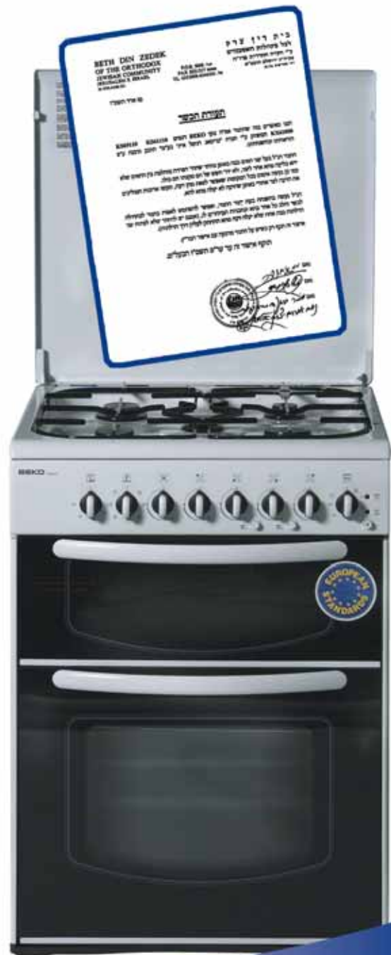
התמונות להמחשה בלבד, ט.ל.ח. **עד 10 תשלומים, מותנה באישור חברות

BEKO - בקו הנו מותג מוצרי חשמל מהגדולים והידועים בעולם. במוצרי BEKO הושקעו סכומים נכבדים בתכנון ופיתוח בקו מוצרים בעלי עיצוב וטכנולוגיה מהמתקדמים בעולם. מוצרי BEKO מובילים בכל תחומי ענף החשמל: מקררים, מכונות כביסה, מייבשים, מדיחי כלים, תנורים דו-תאיים, תנורים בנייים וכיריים, ומוצרים קטנים כשואבי אבק, מגהצים מיקרוגלים ועוד.