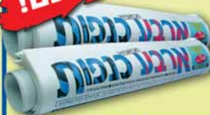
מנוי שנתי לעתון 'ארבע כנפות'