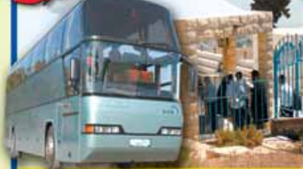
טיול לאתרים בצפון