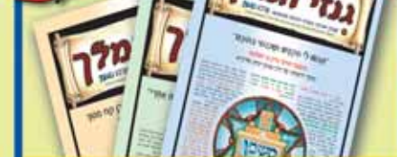
מנוי שנתי ל'גנזי המלך'