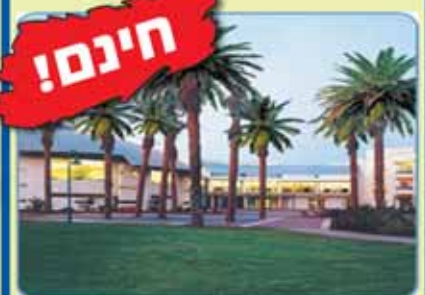
סוף שבוע ששי שבת עם הרב אמנון יצחק