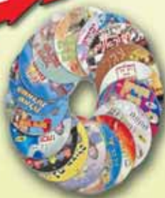
CD לצפיה או לשמיעה