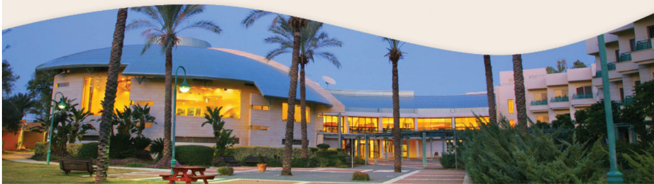
בע"ה נעשה ונצליח

סוף שבוע ארוך פרשת 'חקת' יתקיים בתאריך ה'-ז' תמוז 17-19/06/2010