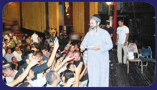
תמונות מהרצאתו של הרב אמנון יצחק שליט"א השבוע בעכו

כשהמוכר כבר עמד בפתח חנותו ובא הקונה לקנות ושכח לסגור את דלת המקרר; לדעת השו"ע: חייב. ולדעת הרמ"א: פטור. אם הוציא חלק מהגלידות חוץ למקרר, אף שהחזירם למקרר שנשאר פתוח וניזוקו, חייב לכו"ע כמזיק. כשפתח ולא סגר את דלת המקרר בזמן שיש קונים בחנות פטור, דלא נחשב לברי היזיקא.