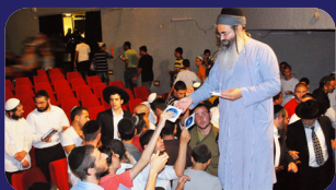
תמונות מהרצאתו של הרב אמנון יצחק שליט"א השבוע בחולון

אלא הביאור: דבאמת הגזירה היתה אתמול. כמו שכתוב: "הַפְּדִלוּ מִתּוֹךְ הָעֵדָה הַזֹּאת וְנֹאכְלָה אֹתָם פְּרָגַע" היינו: לכל העדה ח"ו. אלא שמשה ואהרן בתפילתם שנפלו על פניהם ואמרו: "הָאִישׁ אֶחָד יִקְטֹא וְעַל כָּל הָעֵדָה תִּקְרָף" ? בטלו את הגזירה ההיא. ועתה שחזרו והתלוננו, נתחדשה הגזירה שיקחו מהם איזו תרומה. וזהו לשון: "ה'רמו" . ור"ל: שיקחו מהם כמו תרומה. "וְנֹאכְלָה אֹתָם"