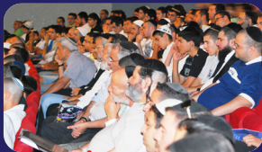
תמונות מהרצאתו של הרב אמנון יצחק שליט"א השבוע בחולון