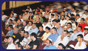
תמונות מהרצאתו של הרב אמנון יצחק שליט"א השבוע בעכו