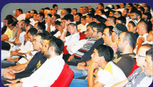
תמונות מהרצאתו של הרב אמנון יצחק שליט"א השבוע בחולון

לאזור כפר סבא, הרצליה, רעננה והסביבה - סימה 050-9558033 077-4403314