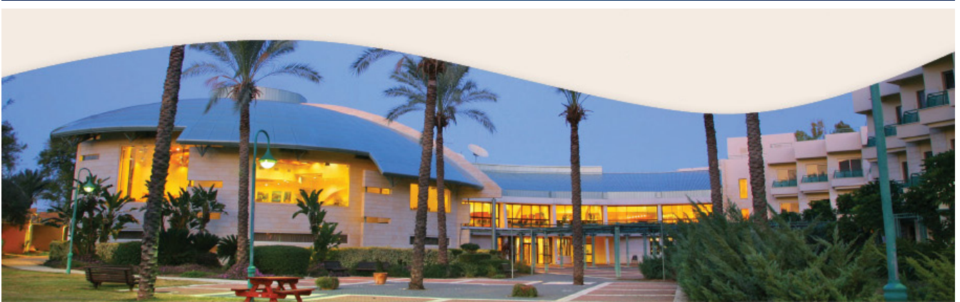
בע"ה נעשה ונצליח

סוף שבוע ארוך פרשת 'חקת' יתקיים בתאריך ה'-ז' תמוז 17-19/06/2010