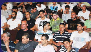
תמונות מהרצאתו של הרב אמנון יצחק שליט"א השבוע בעכו

דרושים מתנדבים לשדך בין האברכים ללומדים בשעות אחר הצהריים - ערב