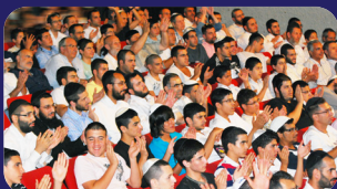
תמונות מהרצאתו של הרב אמנון יצחק שליט"א השבוע בחולון

תשובה: אסור. ורק בהפסד מרובה אפשר להקל. כתב השו"ע: 'יש מתירים לטלטל כלי שמלאכתו לאיסור, אפילו מחמה לצל,