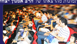
תמונות מהרצאתו של הרב אמנון יצחק שליט"א בשבוע שעבר בתל אביב