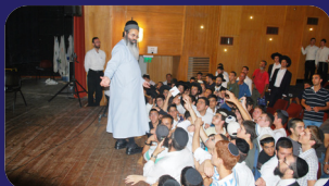
תמונות מהרצאתו של הרב אמנון יצחק שלישי"א בשבוע שעבר בגבעת זאב