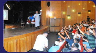
תמונות מהרצאתו של הרב אמנון יצחק שליט"א בשבוע שעבר בגבעת זאב

יציאה מנקודות האיסוף בשעה 7:30 בדיוק! הישיבה בהפרדה מלאה! ההרשמה במשרדי 'שופר' רח' מתתיהו 10 בני ברק 03-6777779 לאזור כפר סבא, הרצליה, רעננה והסביבה - סימה 050-9558033 077-4403314