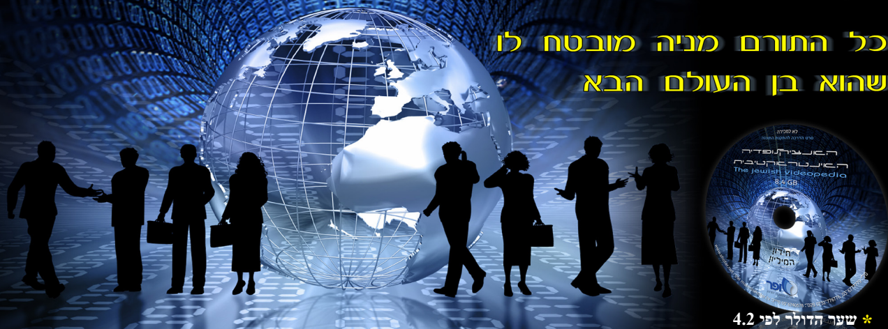
* שער הדולר לפי 4.2

כל החורם מניה מובטח לו שהוא בן העולם הבא