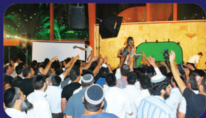
תמונות מהרצאתו של הרב אמנון יצחק שליט"א בשבוע שעבר בנתיבות