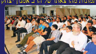
תמונות מהרצאתו של הרב אמנון שליט"א בשבוע שעבר במבשרת ציון