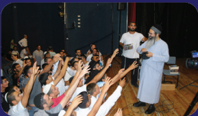
תמונות מהרצאתו של הרב אמנון יצחק שליט"א בשבוע שעבר במושב נהורה

הרי לפנינו שהנגיעה לצד אחד מקלקלת את משפט השכל, באופן שאינו מעלה על דעתו סברא המנגדת לנטייתו. ונוכל להבין דבר זה היטב ע"פ מה שהקדמנו, שההתענינות היא שמעוררת את המחשבה. וא"כ מובן שלא תעורר סברא המנגדת לה, אדרבא תעלים אותה ולא עוד אלא אפילו כאשר אחרים אומרים לו סברא כזו, שכלו ממאן לקבלה מפני השפעת הנגיעה. כן ביאר המהר"ל (גור אריה'): 'יענר עיני