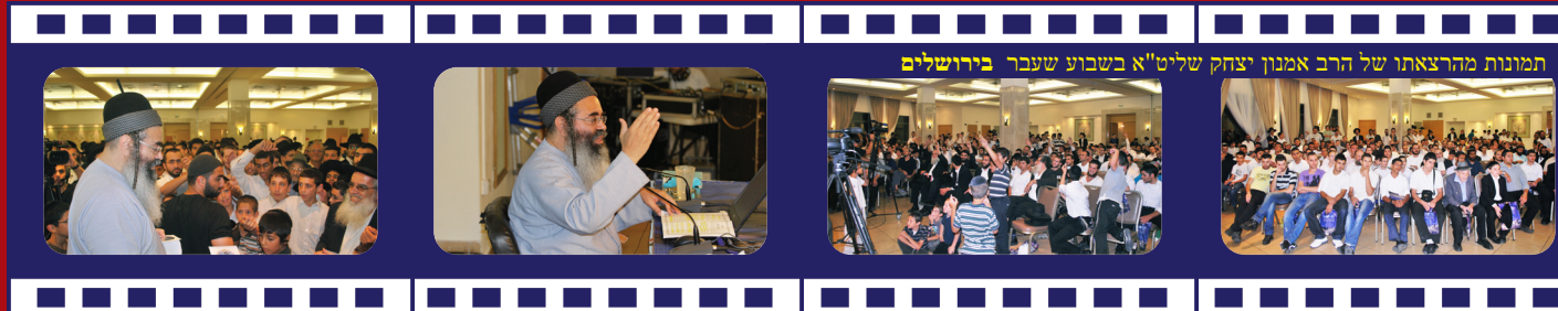
תמונות מהרצאתו של הרב אמנון יצחק שליט"א בשבוע שעבר בירושלים

טוב אחד בצער ממאה שלא בצער אמרתי לחזק ידים רפות; שלא להתרשל מעסק התורה, אף בעת הזו שמצוקי הזמן הולכים ומתרבים מידי יום ויום ושפע הפרנסה הולך ומתדלדל בעוונותינו הרבים וכל איש ואיש נושא בכבדות על צוארו עול הפרנסה, להחיות נפשו ונפש בני ביתו וגם מוקף מכל צד בדאגות ומכאובים, אשר העול הקשה ומכאוביו הרבים לא יתנוהו כלל לחשוב עבור אחריתו לקחת לנפשו חיי נצח.