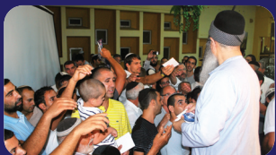
תמונות מהרצאתו של הרב אמנון יצחק שליט"א בשבוע שעבר בגן יבנה

מי שלא טיהר את לבבו עדיין, אין לו שום סיכויים להסיק מסקנות של אמת, באמת כן הוא, בטוח לא יוכל להיות לעולם, אבל מבחן זה יוכל לנקוט בידו, אם דעה, או החלטה, תבוא לו בלי מלחמה, יחשוד בה ויחפש באיזו פינה הסכימו איתה נגיעותיו ורק דעה והחלטה שתעלה בידו בקושי, מתוך התאמצות להכרת האמת ומתוך מלחמה נגד הנגיעות, רק בה אפשר שתהיה לו תקוה שתהיה אמיתית. (מכתב מאליהו' א דף 53).