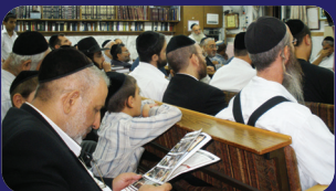
תמונות מהרצאתו של הרב אמנון יצחק שליט"א בשבוע שעבר בביהכ"ס בורוכוב

"מה נַעֲשֶׂה לְאַחַתְנוּ בַּיּוֹם שְׁיִדְבַר בָּהּ"; קאי על הנסיון של אור כשדים, שצריך גבורה רבה לזה, "נִשְׁנִים אֵין לָהּ" שלא הניקוהו במצוות ומעשים טובים, שיסוד הגבורה, הוא תורה ומעשים טובים! יסוד הגבורה, הוא קדושה! מהיכן היתה גבורת שמשון? אם לא מנזירות שהיא יסוד הקדושה! מאין היו הראשונים חזקים כל כך מאריות גברו? אם לא שהניקוה בתורה