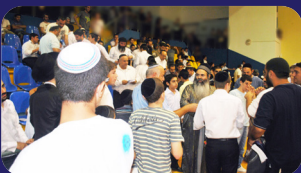
תמונות מהרצאתו של הרב אמנון יצחק שליט"א בשבוע שעבר בטבריה

שאלה שנשאל הרב בן ציון מוצפי שליט"א בקשר לזמרים א. אולי זאת גזרה שאי אפשר לעמוד בה, כפי שאני שומע מידי יום ביומו במגזר החרדי? ב. עד שיש זמרים טובים במגזר הדתי - איך בנאדם ימנע מלשמוע מוזיקה, אם