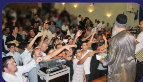
תמונות מהרצאתו של הרב אמנון יצחק שליט"א בשבוע שעבר במעלה אדומים