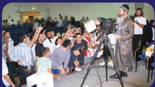
תמונות מהרצאתו של הרב אמנון יצחק שליט"א בשבוע שעבר בקריית אונו