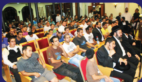
תמונות מהרצאתו של הרב אמנון יצחק שליט"א בשבוע שעבר בתקוע ואשקלון

איתא בגמרא (ב"מ פו:): שלח אאע"ה את אליעזר לראות היש בחוץ מי שאפשר לגמול עמו חסד, חזר ואמר שאין נפש. אאע"ה לא האמינו ויצא בעצמו לחפש אורחים, כדי לגמול חסד. ולא היה חסר לו אורחים, אלא יום אחד בלבד. שהרי מבואר בחז"ל שהוציא הקב"ה חמה מנרתיקה כדי שלא להטריחו באורחים. מ"מ אאע"ה אינו במנוחה ואי עשיית החסד טורדו יותר