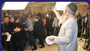
תמונות מהרצאתו של הרב אמנון יצחק שליט"א בשבוע שעבר באשדוד

מורה לנו, כי יש אפשרות של תשובה, גם בתוך היסורים היותר גדולים, גם בשעה שאדם שקוע באימת מות של מיתה משונה תכף ומיד, בשעה זו אפשר לאדם היותר פחות היותר מושחת, לבוא לתשובה שלמה ומאבה, דבר זה מחייב אותנו בלימוד המוסר חובה רבה, כי דרכו של אדם להתנצל בזה שאינו בטוח בתועלת היוצאת מן הלימוד, לו היה כל אחד בטוח בתועלת של מחשבה שלו, בתועלת של הרגשה שלו, אז לא היה מי שמתרשל בזה, כי עבודה קלה היא ופריה רב, אבל עתה בטלה כל התנצלות, כי אין מי שמחזיק עצמו גרוע כאיש מצרי ולו חיכה הקב"ה באותה שעה לתשובה שלמה. (תורת אברהם) . ■