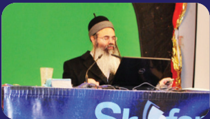
תמונות מהרצאתו של הרב אמנון יצחק שליט"א בשבוע שעבר בבית דגן