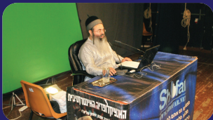
תמונות מהרצאתו של הרב אמנון יצחק שליט"א בשבוע שעבר במצפה רמון

משה רבנו בא להעביר בעד בני ישראל ולבסוף הוא מגדיל את חטאם? ברם, התנאי העיקרי לתשובה הוא, להכיר בחטא, שלא לחפש אחרי תירוצים והקלות, אלא שיוודה האדם, כי נכשל בחטא וכי מתחרט הוא ע"כ בשברון לב. מכיון שניסה אדם הראשון לתרץ את חטאו; "הֲאִשָּׁה אֲשֶׁר אֲשַׁר נָתַתָּה עִמָּדִי הִיא נָתַתָּה לִי" לא הועילה לו תשובתו. כאשר רצה משה רבנו שתתקבל תשובתם של ישראל, אמר: "חֲטָא הָעָם הַזֶּה חֲטָאָה גְּדוֹלָה" מודים הם שחטאו חטאה גדולה, אינם מנסים לתרץ ולהצדיק את חטאם, כי אם