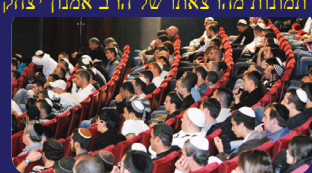
תמונות מהרצאתו של הרב אמנון יצחק שליט"א בשבוע שעבר באילת