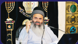
תמונות מהרצאות של הרב אמנון יצחק שליט"א בשבוע שעבר בבני ברק

"אתם" בלי ואו. דורשים חז"ל; "וְעֲשִׂיתֶם אֹתָם" 'תעשו את עצמכם'. זו דרגה מיוחדת שזוכים לה ע"י; "אם פְּחַקְתִּי תִלְכוּ" שתהיו עמלים בתורה. שמעתי פעם מרבי מאיר חדש שדיבר פעם על הפסוק וְדַרְשַׁת חֲז"ל; ש'עמי ארצות, זדונות נעשים להם כשגגות' כי הם לא אשמים. אבל 'תלמידי חכמים, השגגות נעשים להם כזדונות' . והתמיהה צפה ועולה, עמי ארצות יוצאים נשכרים שהזדונות נעשים להם כשגגות ואילו תלמידי חכמים מפסידים, שהשגגות נעשים להם כזדונות, אתמהה?! "יש כמה תירוצים לבאר את הגמרא הזו" אמר לנו רבי מאיר; "אבל אני לא אומר לכם תירוצים, אני אומר לכם; תקבלו מכות! לא יועיל לכם שום דבר! שגגות נעשים לכם כזדונות. וגם אין אפשרות עתה להיות בחזרה עמי ארצות, לא יועיל לנו מאומה, כבר נתפסנו, אנו בני ישיבה! אם כעת נהיה