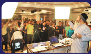
תמונות מהרצאתו של הרב אמנון יצחק שליט"א בשבוע שעבר בתל אביב

הדחפים הבאים מן האנוכי, הם מהחזקים ביותר בכחות הכהים הפועלים באדם מתחת לסף ההכרה ויש בידם לדחות גם את אהבתו לידידיו וקרוביו החביבים עליו ביותר. אין זאת אומרת שאין אהבתו אליהם שלמה, יכול להיות שלבו מלא אהבה אבל זה בחיזיונות הלב, בתת הכרה עדין אהבת עצמו קודמת. פוק