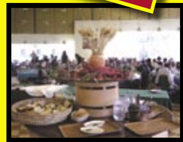
ר' יונתן בן עוזיאל-עמוקא