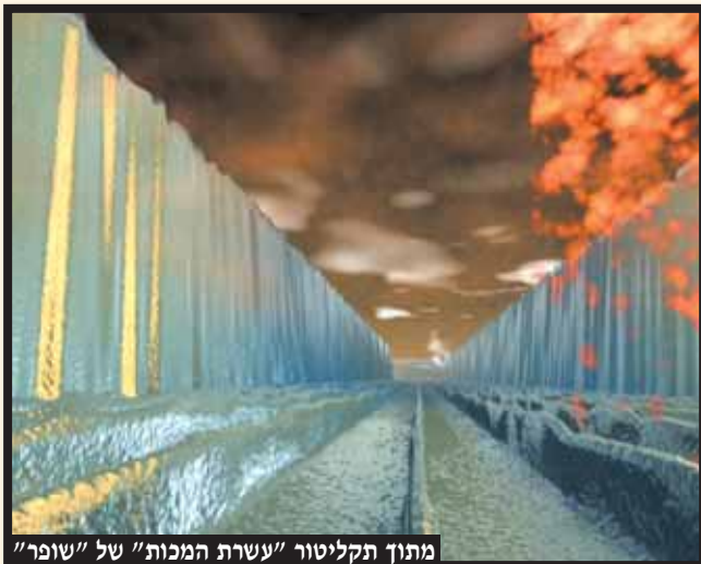
מתוך תקליטור "עשרת המכות" של "שופר"

ובמזמור: "נִגְדַר אֲבוֹתַם עָשָׂה פְּלֵא" (תהילים עז) גם מובא י"ב דברים: א. "רְאוּךָ מֵיָם אֱלֹקִים" ב. "רְאוּךָ מֵיָם יְחִילוֹ" ג. "אֶף יִרְגְּזוּ תַהֲמוֹת" ד. "זְרַמְנוּ מֵיָם עֲבוֹת" ה. "קוֹל נִתְנָנוּ שְׁחָקִים" ו. "אֶף חֲצִצִּיף יִתְהַלְכוּ" ז. "קוֹל רַעְמָךְ בְּגִלְגַל" ח. "הָאִירוּ"