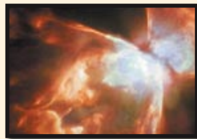
הקיימים בעולם: מים, עפר, אש ורוח וכל נברא אינו יכול לצאת מטבעו. (וצ"ב למה המאורות. ■

בגמרא מסכת חולין (קכו.): 'אמר רבי עקיבא: 'יש לך בריות גדולות בים ויש לך בריות גדולות ביבשה. שבים - אלמלי עולות ביבשה מיד מתות. שביבשה - אלמלי יורדות לים מיד מתות. יש לך בריות גדולות באור (סלמנדרא) ויש לך בריות גדולות באויר. שבאור - אלמלי עולות לאויר מיד מתות, שבאויר - אלמלי יורדות לאור מיד מתות. (הוי אומר): "מָה רַבּוּ מַעֲשֵׂיךָ ה' " (תהלים קד