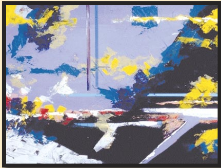
תוספת שאינה צריכה.

שגם כאן יש סרה עורף שלא זקוקים לו. אבל אצל יעקב, היו לו רק שנים עשר השבטים הקדושים ולכן עליו נאמר: "ל" שזה הכי טוב! כאשר ישראל לא עושים רצונו של מקום חלילה, כלומר: נמצאים במצב של "כל" , שיש תוספות לא רצויות, אזי ידו של ישמעאל שולטת בנו - "כל" (בר' טז יב).